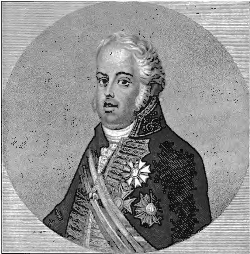
EL-REI D. JOÃO VI