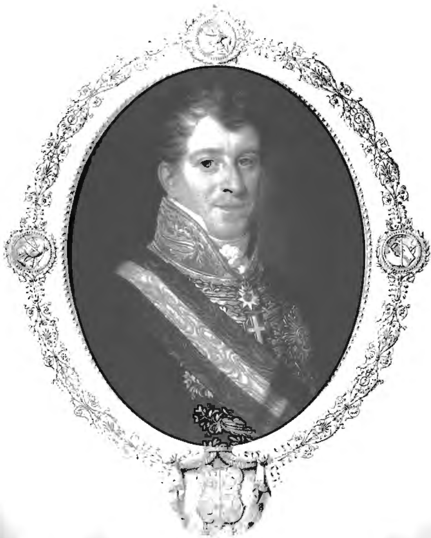
Conde de Palmella