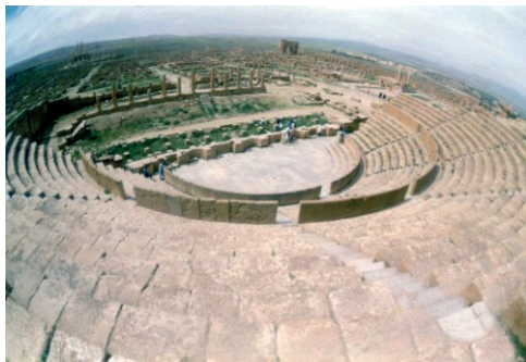
Teatro Romano de Timgad.

YAZBEK, Mustafã. Argélia: a guerra e a independência . São Paulo: Brasiliense, 1983.