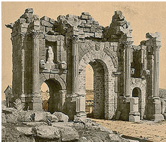
Arco romano de Trajano. Grande número de ruínas dos templos romanos são atrações para turistas e pesquisadores.

A Argélia Independente nacionalizou os hidrocarburetos, adotou por referendo a Constituição Nacional, realizou eleições municipais e criou um Conselho Consultivo Nacional. Em 30 de maio de 2007, as eleições legislativas pluralistas deram a vitória à Frente de Libertação Nacional, que também ganhou as eleições municipais e culminou toda essa atividade de alicerçamento político. Em 29 de setembro de 2005, opta pela adoção, em referendo, da Carta pela Paz e pela Reconciliação Nacional.