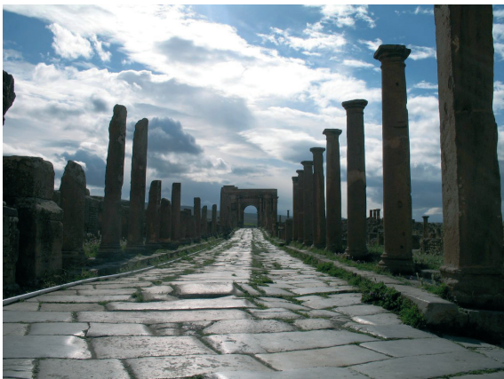
Uma rua de Timgad com o Arco de Trajano ao fundo.

experiências culturais que fazem da Argélia um potencial de criatividade ao nível mundial. A arquitetura é a manifestação artística por excelência.