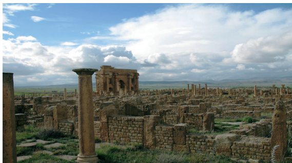
Vista de Timgad com o Arco de Trajano ao fundo.

A UNESCO declarou como lugares de Patrimônio Mundial as Ruínas Romanas de Timgad e as de Djemila, o sítio arqueológico de Tipasa, Tassili n´Ajjjer, o Valle de M´Zab, a Casbah de Argél e a Kalâa de Beni Hammad.