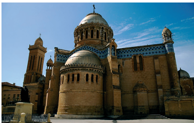
Basilica Nossa Senhora da África.

Depois várias revoltas e combates foram regis- trados, no século XX, um movimento político. Nasceu para pedir à independência da Argélia. Depois da Se- gunda Guerra Mundial, o povo argelino fez a festa da vitória, mas foi alvo de repressão em 8 de maio de 1945, onde contabilizaram mais de 45.000 mortos. Em 1º de novembro 1954 começou a revolução armada que aca- bou em 19 de março de 1962 com mais de 1,5 milhões de mortos. A independência foi proclamada em 5 de julho de 1962.