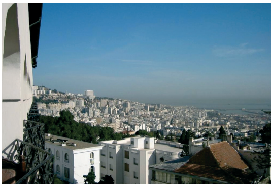
Vista da cidade de Argel, capital.