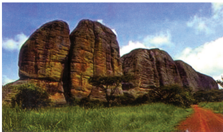
Paisagem em Malange

Nesse sentido, para o PIB não petrolífero perspectiva-se um crescimento de 5,7 por cento, liderado pelos sectores da agricultura, da energia, da indústria transformadora e dos serviços mercantis.