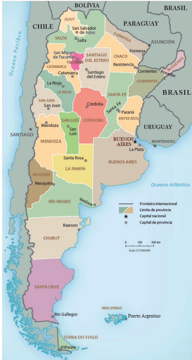
Mapa político da Argentina