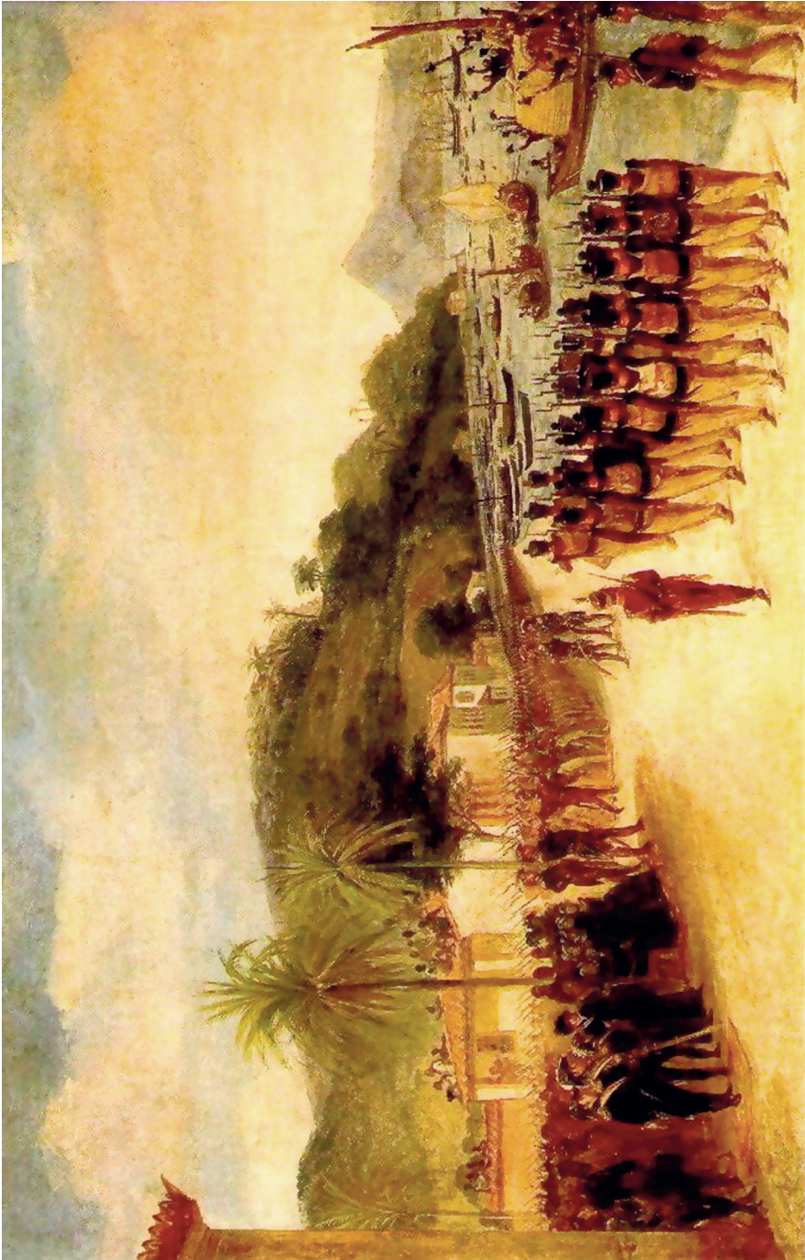
Quadro a óleo de Jean-Baptiste Debret: Embarque na Praia Grande de tropas destinadas ao bloqueio de Montevideu, 1816.