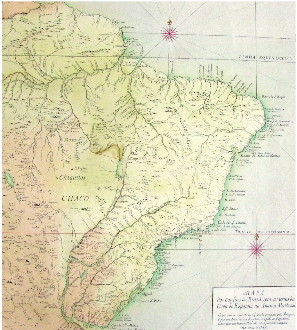
Mapa dos confins do Brasil com as terras da Coroa de Espanha na América Meridional