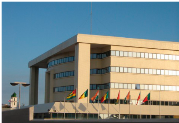
Banco Central de Bissau

O país dispõe de importantes potencialidades que permitem desenvolver um turismo especializado, valorizando as riquezas naturais, patrimoniais, ecológicas e culturais. Com meia centena de ilhas de imenso areal branco e de águas cristalinas que compõem os arquipélagos dos Bijagós, o país possui algumas das mais lindas praias da costa ocidental africana. Estes potenciais tornam a Guiné-Bissau num dos paraísos turísticos menos explorados na África. A isso se junta a riqueza do ecossistema e uma das biodiversidades mais bem conservadas e ricas do planeta, fatores que podem ajudar na criação