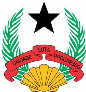
Brasão da República História e Política

O primeiro império a invadir o território que hoje é conhecido por Guiné-Bissau foi o Império Gana por volta do século V. Antes da chegada dos europeus e até o século XVII, a quase totalidade do território da Guiné-Bissau integrava o reino de Gabu, tributário do legendário Império Mali, dos mandingas, que florescera a partir de 1235. A Guiné-Bissau foi uma das primeiras regiões de África a serem exploradas pelos portugueses e o primeiro navegador europeu a chegar à costa da atual Guiné-Bissau foi o português Álvaro Fernandes, em 1446.