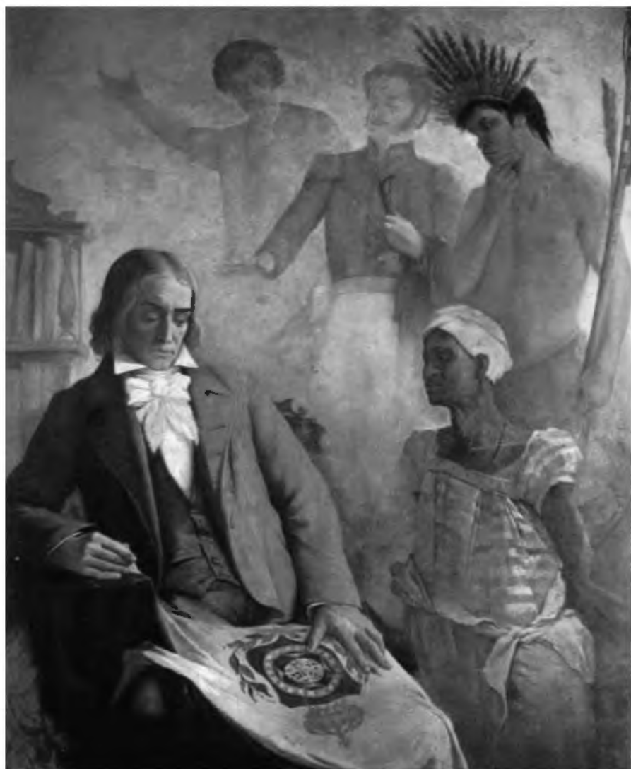
As três raças e a formação da Bandeira do Brasil (Quadro de Eduardo de Sá)