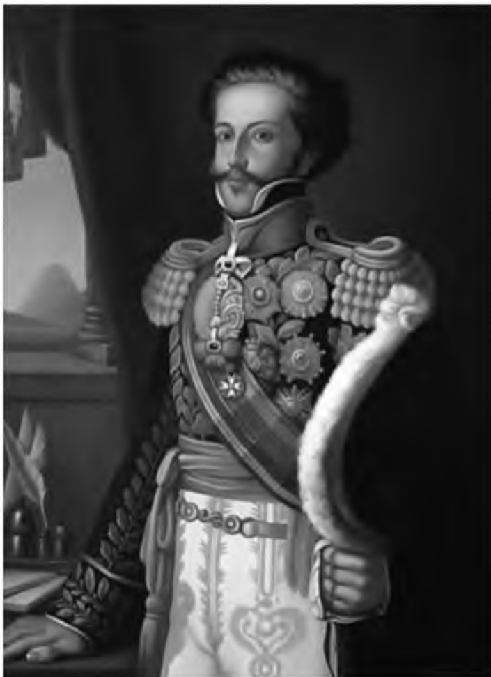
DOM PEDRO I ( Primeiro Imperados do Brasil ) 1798 - 1834