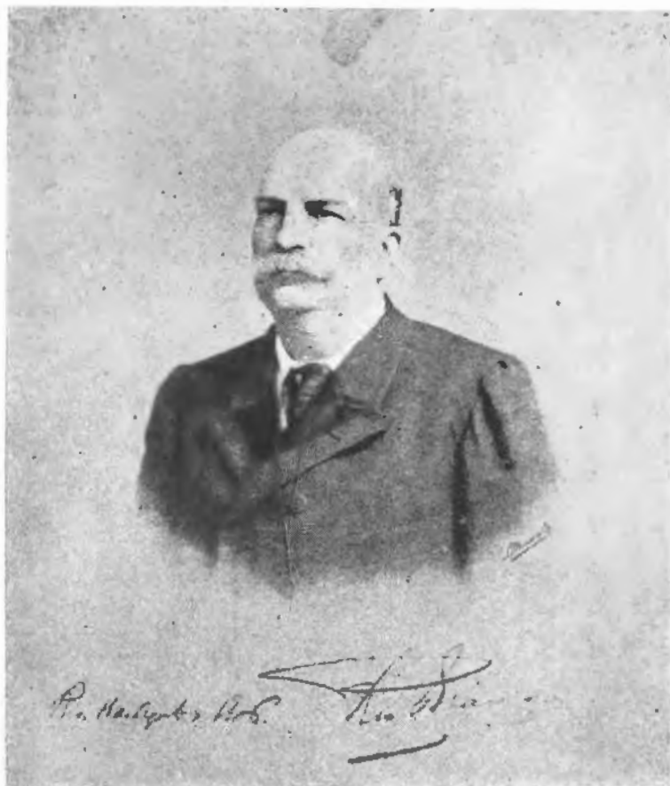
BARÃO DO RIO-BRANCO ( José Maria da Silva Paranhos Junior ) N. a 20 de Abril de 1845. - F. em a 10 de Fevereiro de 1912