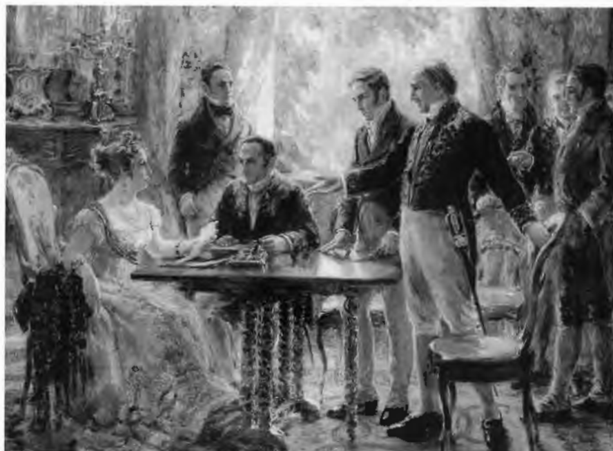
Sessão do Conselho de Estado, a 2 de Setembro de 1822, sob a presidência da princesa d. Leopoldina, depois primeira imperatriz do Brasil. (Quadro de Georgina de Albuquerque.)

Schema do quadro: "Sessão do Conselho de Estado" (1822)