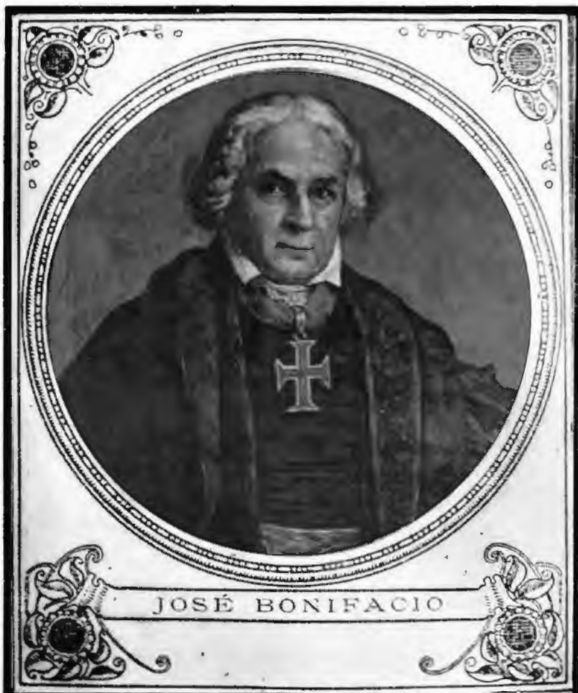
JOSÉ BONIFÁCIO DE ANDRADA E SILVA ( Patriarca da Independência ) 1763 - 1838