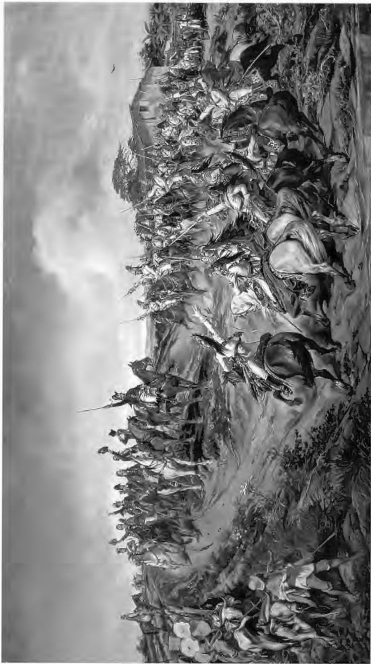
Proclamação da Independência nos campos do Ipiranga - (Quadro de Pedro Américo)