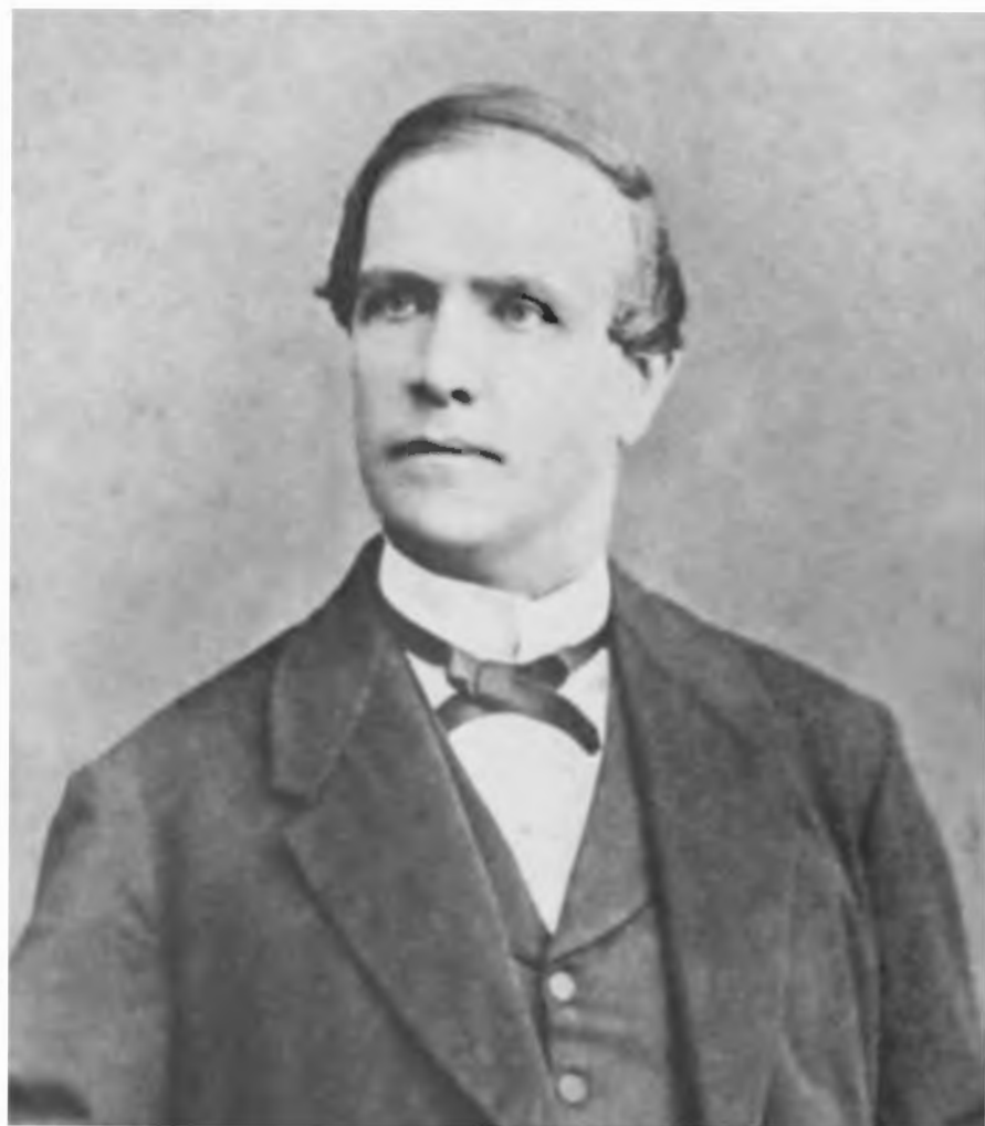
FRANCISCO ADOLFO DE VARNHAGEN ( Visconde de Porto-Seguro ) 1816 - 1878