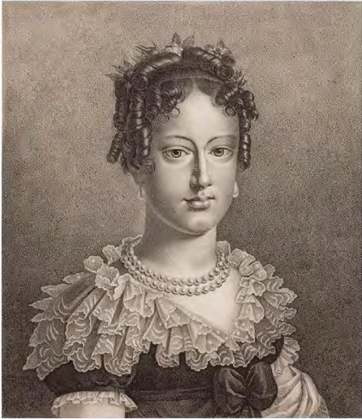
IMPERATRIZ LEOPOLDINA ( Paladina da Independência ) 1797 - 1826