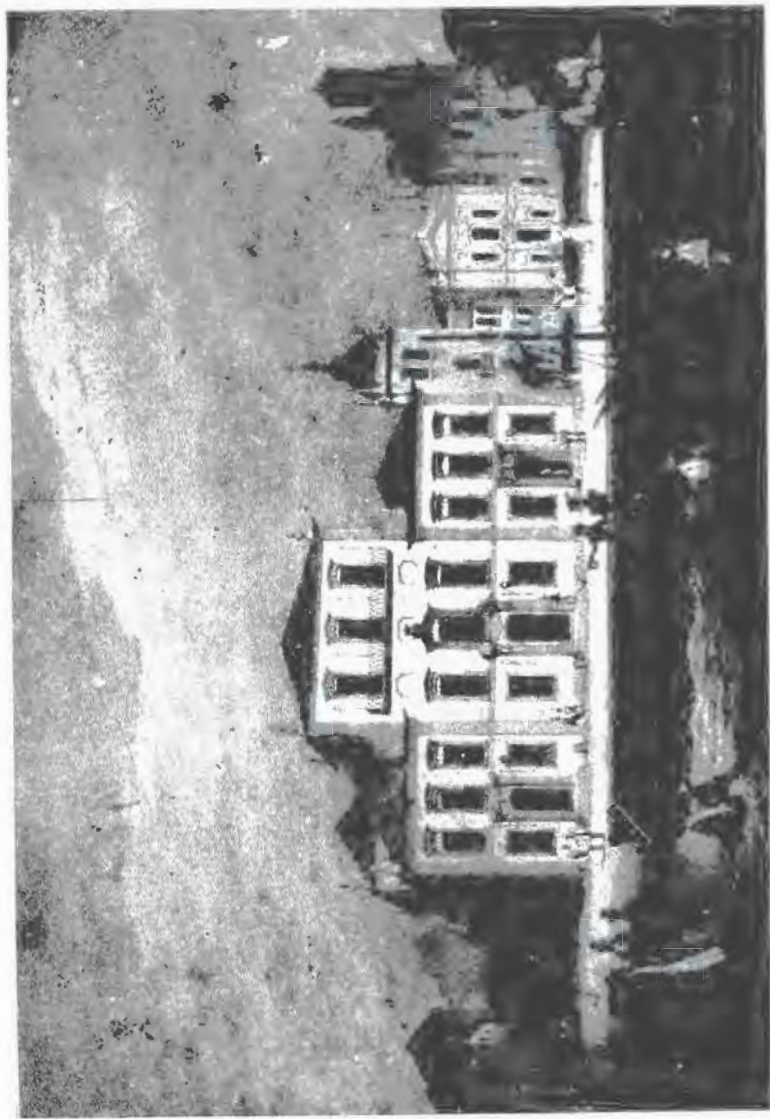
Palácio dos Vice-Reis, depois Palácio da Cidade