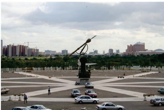
Abuja, capita da Nigéria.