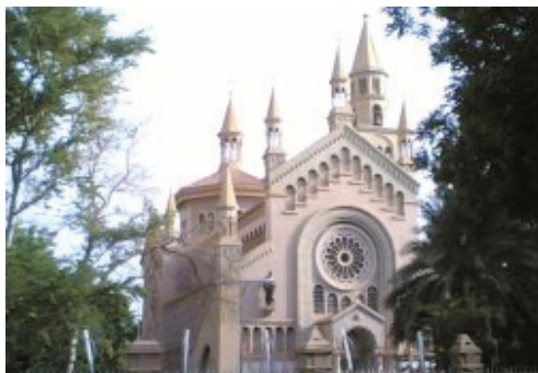
Igreja Católica em Khartoum