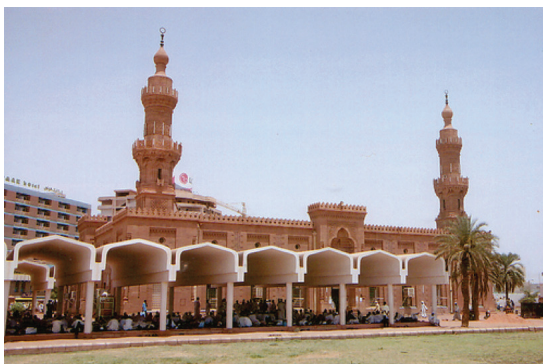
Mesquita Central na cidade de Cartum.

NODINOT, Jean-François. 21 États pour une Nation Arabe . Paris: Maisonneuve & Larose, 1992.