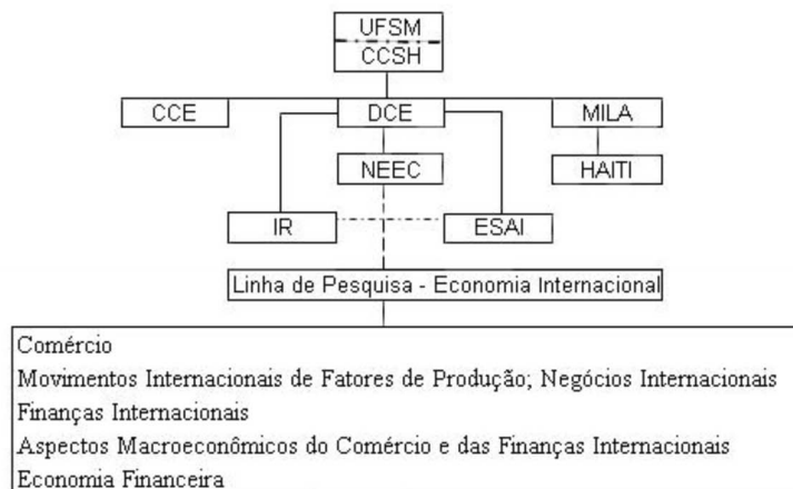
Figura 01 - Configuração Institucional do DCE e Grupos de Pesquisas

A Universidade Federal de Santa Maria (UFSM) foi a primeira Universidade Federal instalada em uma cidade do interior do país. Tem uma estrutura departamental subordinada aos diferentes Centros de Ensino. O Departamento de Ciências Econômicas (DCE) é subordinado ao Centro de Ciências Sociais e Humanas (CCSH) e mantém uma estrutura pessoal e material voltada para o ensino, a pesquisa e a extensão. Em relação ao ensino, oferta disciplinas de variados cursos de graduação, entre os quais o de Ciências Econômicas (CCE), em nível de bacharelado, e do curso de pós-graduação em Integração Latino-Americana (MILA), em nível de mestrado. Quanto à pesquisa, o departamento possui projetos de iniciação científica (IC), monografias de graduação em Ciências Econômicas e dissertações de mestrado do curso de Integração Latino-Americana. Nesse sentido, apoia a iniciativa, individual ou de grupo, de professores que buscam maior identidade e consistência em relação às linhas de pesquisas. Disto surgiu o Núcleo de Estudos Econômicos (NEEC), o Grupo de Pesquisa em Integração Regional (IR) e o Grupo de Estudos de Sistemas Agroindustriais (ESAI), todos os quais concentram esforços na linha de pesquisa em economia internacional . Essas ações, de pesquisa e ensino, são complementadas por atividades de extensão. A divulgação da produção acadêmica conta com o Painel Econômico e a Revista Economia e Desenvolvimento ( http://w3.ufsm.br/eed/ ).