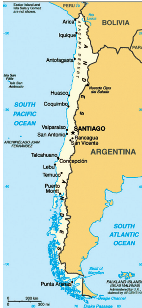
Mapa político do Chile.