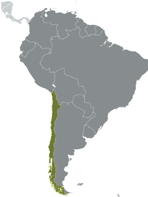
Chile na América do Sul.